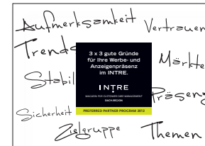
PREFERRED PARTNER PROGRAM 2012